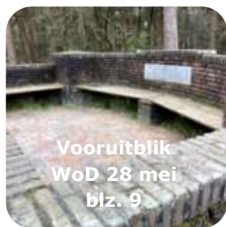
Vooruitblik WoD 28 mei blz. 9