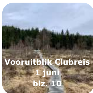
Vooruitblik Clubreis 1 juni blz. 10