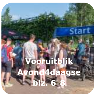
Vooruitblik Avond4daagse blz. 6-8