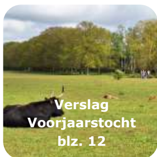
Verslag Voorjaarstocht blz. 12